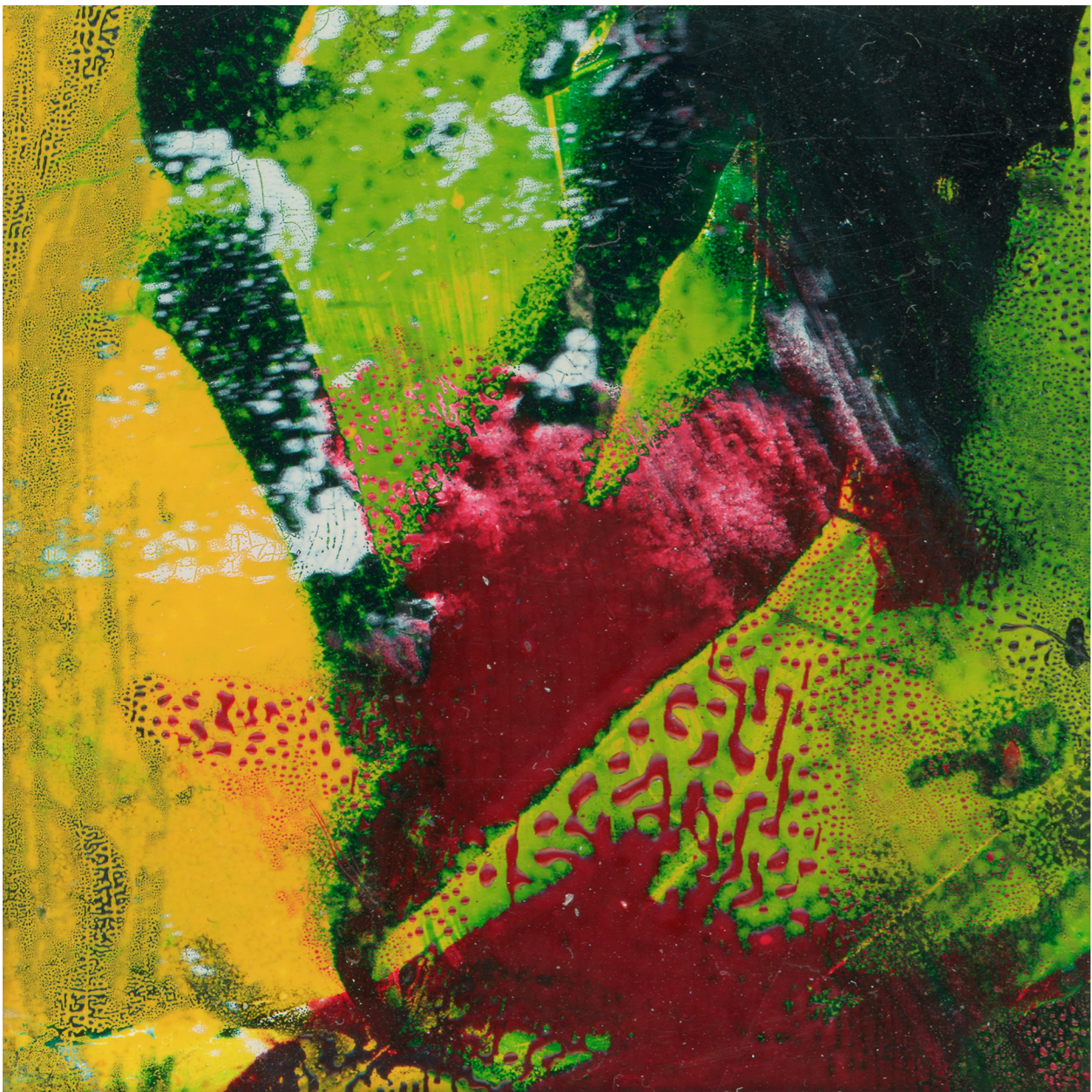
Zavlnění digitální tisk, 2018 143x143 cm

Reprodukce na úvodní straně: plastika pro bývalý hřbitov ve Frýdku