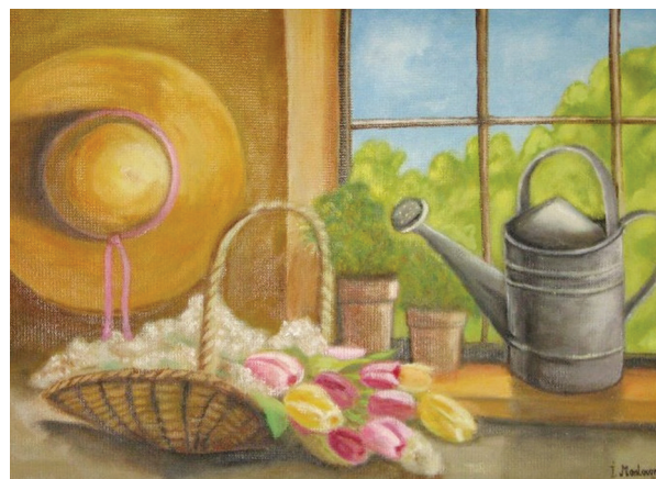
MASTACANOVÁ IVA, 2017

V Y T V A R N Ý K L U B A B 1 1 / Z E M Ě V O D A V Z D U C H