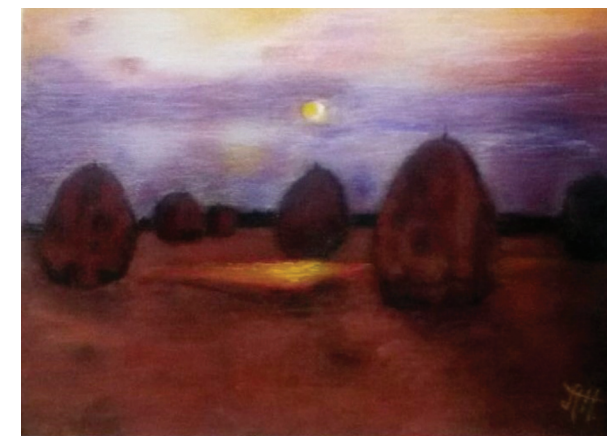
HERODKOVÁ ALEXANDRA, 2017