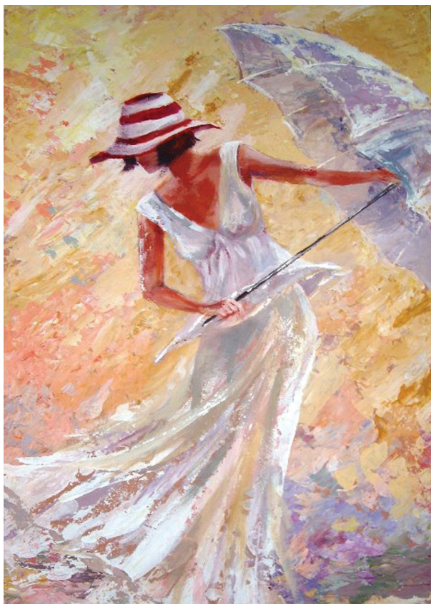
NOVOTNÁ LUDMILA, 2017